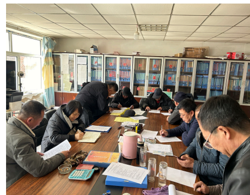
图 6-4 察哈尔右翼中旗一村委座谈