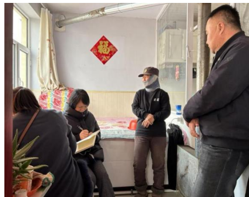
图 6-3 社评组到受影响家庭进行入户访问