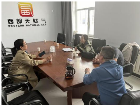
图 6-7 威斯特燃气分公司领导访谈