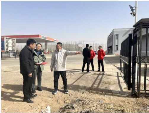
图 6-12 五原县阀室建设地踏勘