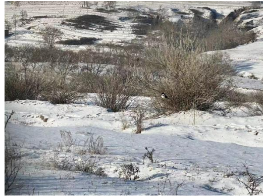
图 6-13 卓资县绿洲坪村光伏项目地踏勘