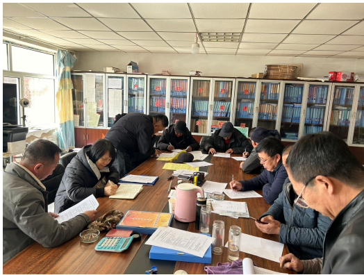
图 6-4 社评组到项目村进行座谈和问卷调查