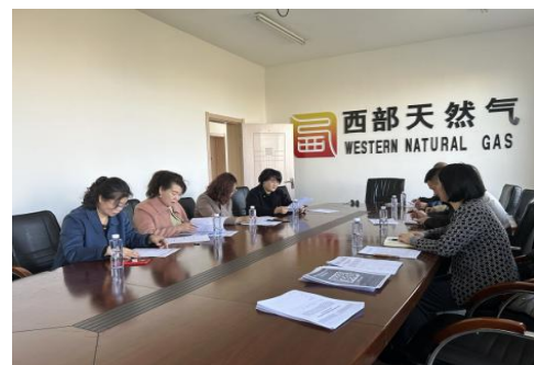
图 6-11 乌兰察布项目区专门妇女访谈