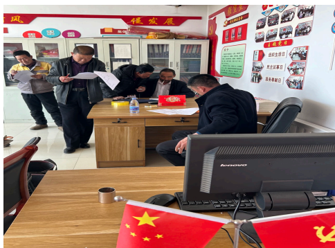
图 6.10 乌兰察布化德县圪臭沟村村民访谈