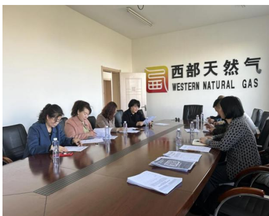
乌兰察布市察哈尔右翼后旗妇女村民访谈填写问卷