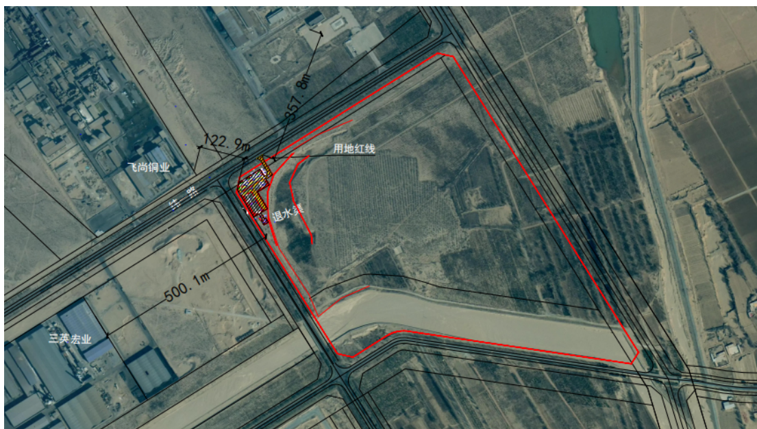
图 1-2 杭锦后旗管线一个分输站站的区位关系图