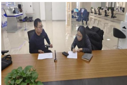
图 6-5 鄂尔多斯市林草局访谈

主要针对项目涉及的各市林草局、民委、妇联、自然资源局等政府部门相关负责人以及妇女、少数民族村民开展了 37 位关键人物访谈，了解市级层面林草用地政策及相关审批程序、民族宗教事务管理、妇女发展以及妇女、少数民族村民家庭基本情况、项目支持度、项目需求等。