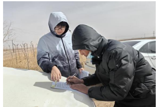
图 6.8-6-9 乌兰察布项目区居民开展问卷调查