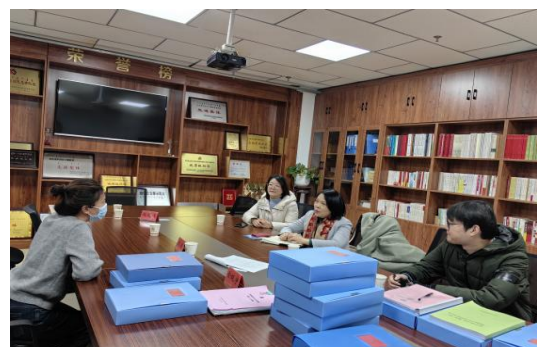
图 6-6 巴彦淖尔市妇联访谈