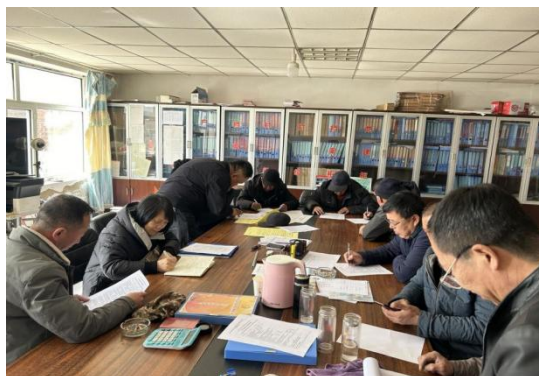
乌兰察布市察哈尔右翼中旗村民填写问卷