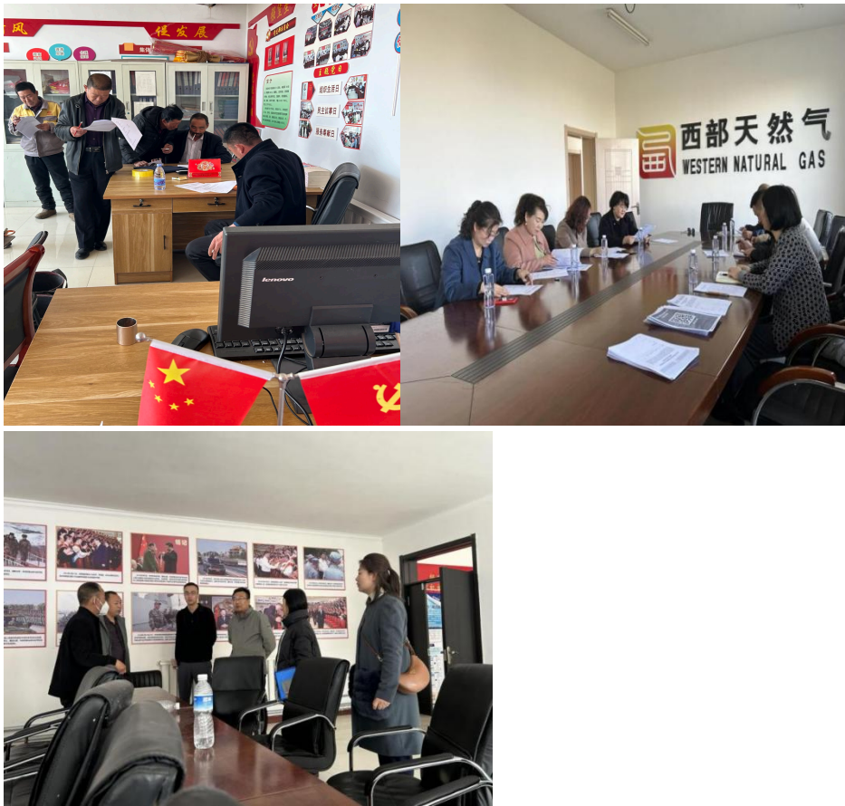
图 6-9 项目实施单位召开的利益相关者座谈会