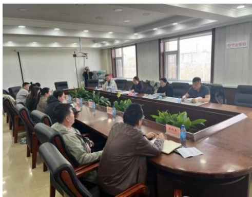
图 6-3 太仆寺旗政府座谈会