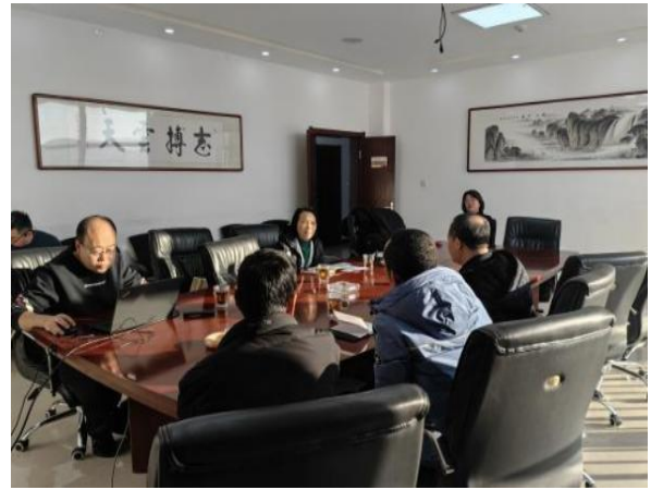
图 6-2 鄂尔多斯纳林河首站站点水清湾