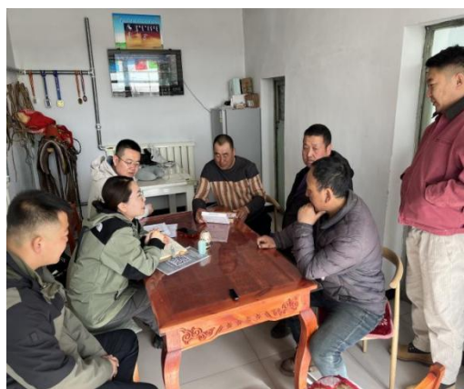
正镶白旗那日图嘎查村民访谈