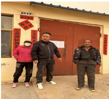
图 6-2 社评调研组走访农户

为深入开展项目社会影响评价，社评工作组赴内蒙古项目区，对本项目可能给当地企业、群众带来的社会影响进行了调研，对本项目建设将给当地带来的社会影响进行了充分的调研和评价。