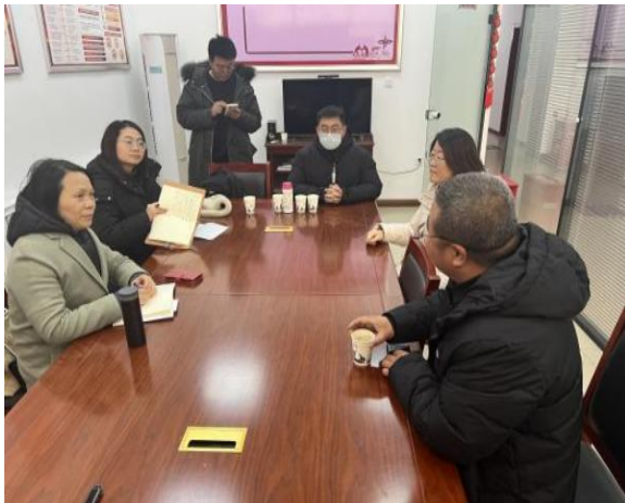
图 6-1 乌兰察布中能光伏用地碌碡坪村