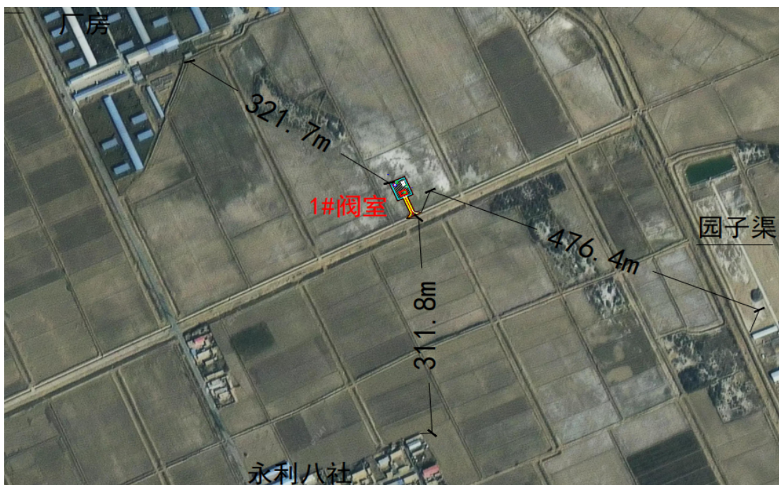
图 1-3 杭锦后旗管线 1 号阀室的区位关系图